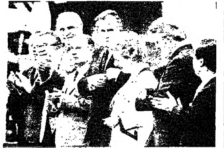
زعامة الدول الصناعية بعد عزف الانشيد الوطني قبل افتتاح قمة هيوستن

دعا الرئيس الامريكى جورج بوش اسس نظراءه رؤساء الدول الصناعية الغربية العظمى الى العمل في قمة هيوستن (تكساس) من اجل استقرار ورفاه «عالم جديد من الحرية، بفضل ثروات نظام التبادل الحر، وصرح لدى استقباله المشاركين في قمة الدول الصناعية السبع في جامعة واين، بيهيوستن ونحن ندعوون معا بصفتنا حلفاء واصدقاء الى العمل هنا في هيوستن من اجل التوصل الى قرارات تعطي استقرارا ورفاهنا جديدا للعالم باستخدامنا قوة وطلاقة الإرادات الحرة والتبادل الحر.